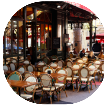
HÔTELLERIE - RESTAURATION