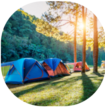
HÔTELLERIE DE PLEIN AIR